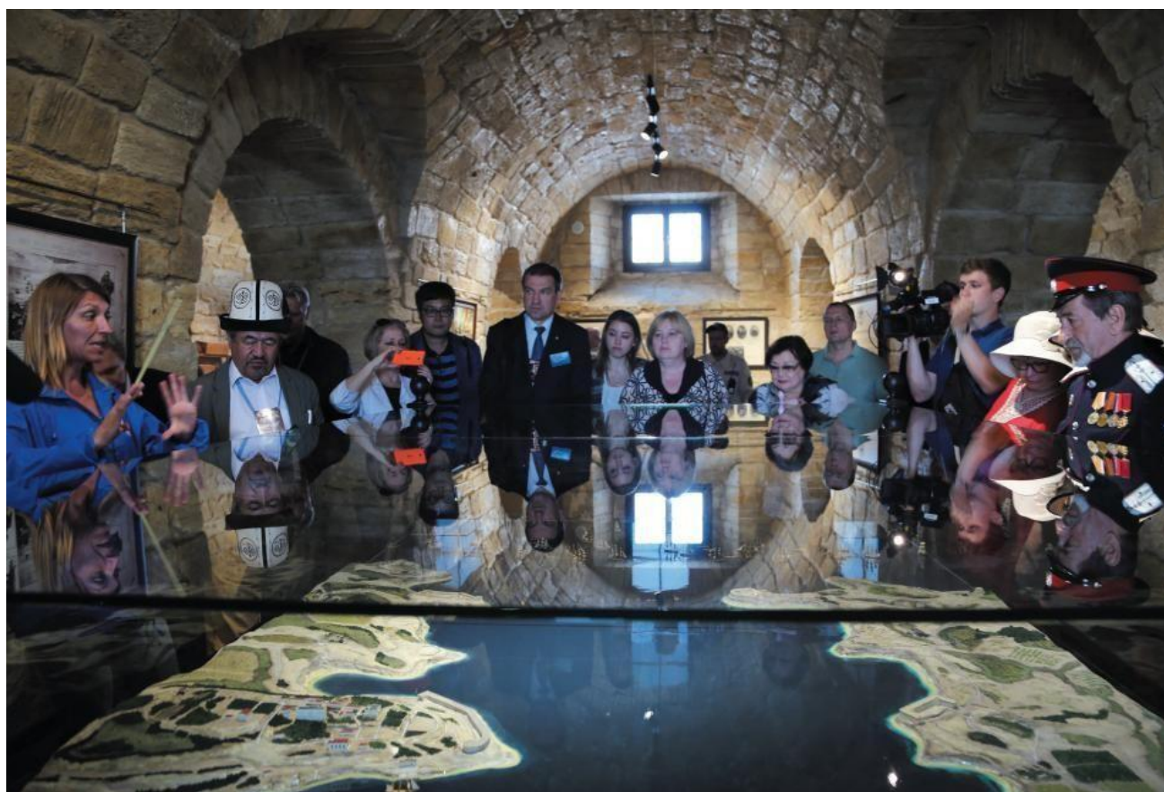
Международный общественный форум «Сохранение памяти о Второй мировой и Великой Отечественной войнах», Севастополь, 16 мая 2019 г

Впервые прошедший в рамках XV Севастопольского международного кинофестиваля «ПОБЕДИЛИ ВМЕСТЕ» в мае 2019 года, Форум был продолжен во время дней Ассамблеи народов Евразии в Баку в октябре 2019 года, где было заявлено о намерении создать Международный общественный комитет «ПОБЕДИЛИ ВМЕСТЕ», который возьмет на себя организацию комплекса действий, направленных на сохранение исторических и духовных уроков величайшей трагедии XX века. В феврале 2020 года очередной Форум был проведён в Ялте в формате международной научной конференции «Ялта-1945: уроки истории».