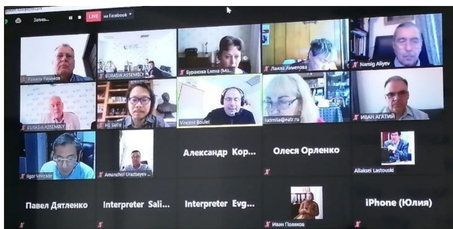
Zoom конференция 7-й сессии Международного общественного форума

«Защитить память о Победе» под таким девизом 7 июля открылась и продолжилась 15-го 7-я сессия Международного общественного форума