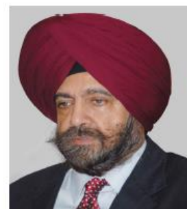
Далбир СИНГХ Секретарь партии Индийский национальный конгресс, президент Фонда политики и управления (Индия)